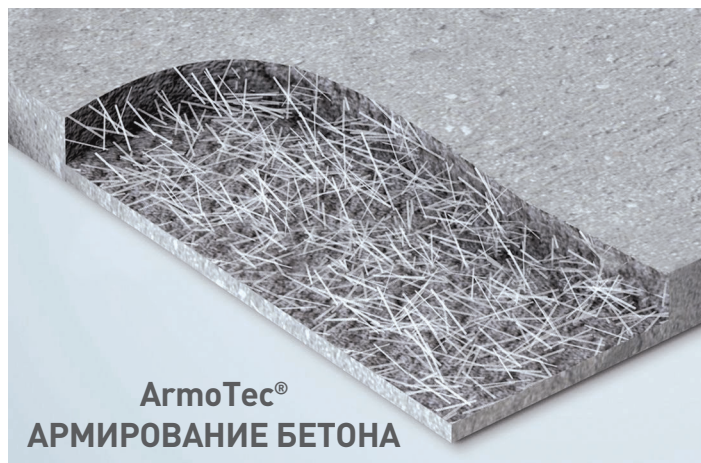
ArmoTec® АРМИРОВАНИЕ БЕТОНА

Здесь отражены технические данные, которые являются результатом статистической информации и не представляют гарантированных минимумов.